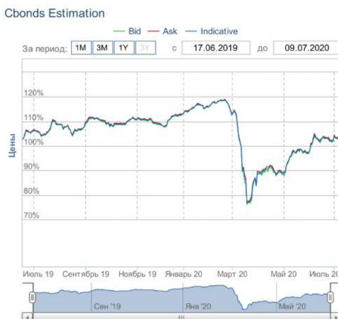
Рис.1. График цены «Еврооблигации: Украина (EUR)» (ISIN XS2015264778)

Для своих клиентов ООО «ФРИДОМ ФИНАНС УКРАИНА» предоставляет 5,3% годовых индикативной доходности в евро. При этом цена и доходность на эти евробонды зависят от рыночной конъюнктуры на международных рынках (см. Рис.1).