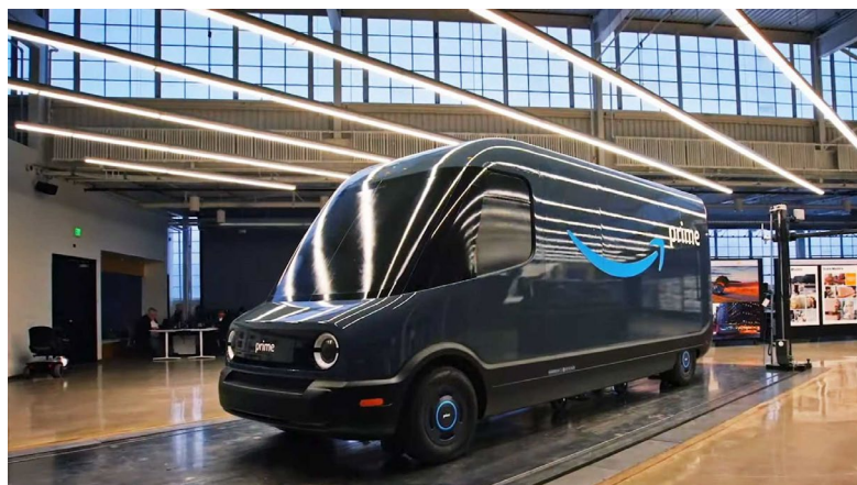
Иллюстрация 1. Rivian Electric Delivery Van

Amazon инвестировал в компанию $1,8 млрд, и сейчас у компании контракт на 100 тысяч Electric Delivery Van с Amazon. Весь заказ планируется поставить к 2025 году.