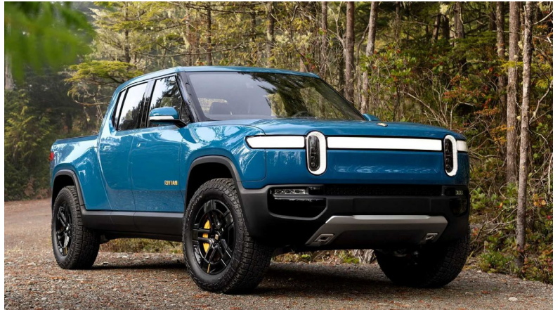
Иллюстрация 2. Rivian R1T