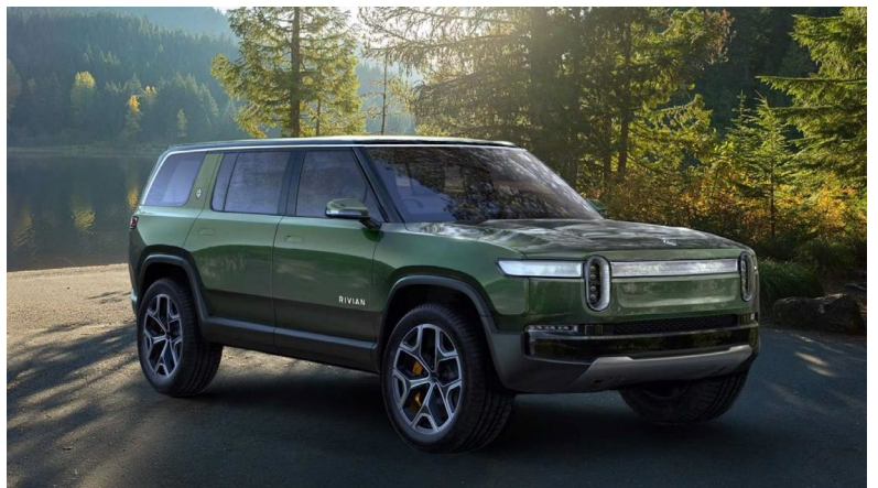
Иллюстрация 3. Rivian R1S

Цена на внедорожник R1S начинается с $70 тысяч, сам внедорожник имеет запас хода около 300 миль при запуске и доступен в пятиместной или семиместной конфигурации.